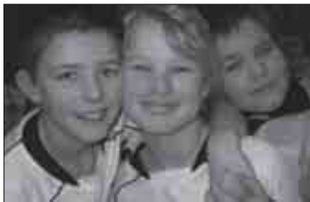
Floorball – Tempo, sjov og sammenhold.

Vi glæder os til endnu en sæson med fart og sjov, glade spillere med krudt i skoene, og skud i stavene.